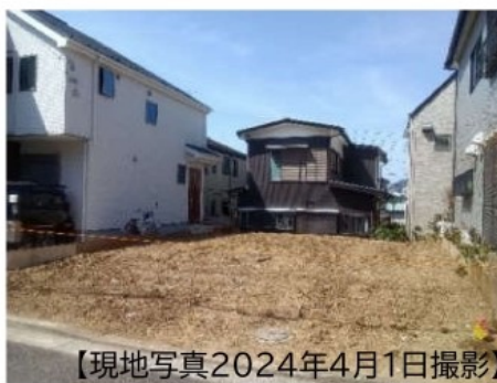
【現地写真2024年4月1日撮影】